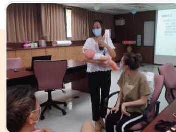
112年新住民育兒知能輔導班