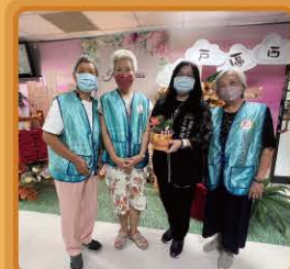
弘道老人基金會到本所致贈多肉植物