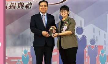
本所同仁榮獲內政部112年度績優戶政人員