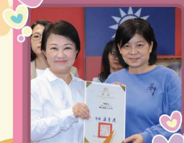
本所同仁榮獲111年度服務 稽核績優服務人員