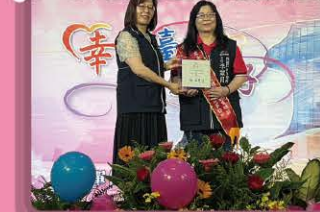
本所榮獲臺中市111年度戶政業務績效 評鑑方案特優戶政機關