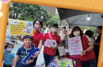
2023臺中市逍遙音樂町 爵醒西區WEST AWAKEN 設攤宣導活動