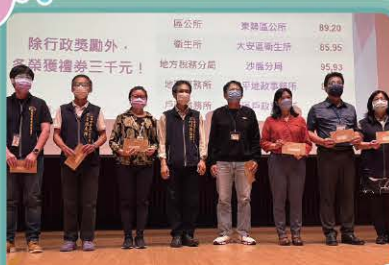
本所榮獲111年度服務稽核成績優良機關