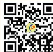
臺中市西區戶政全球資訊網