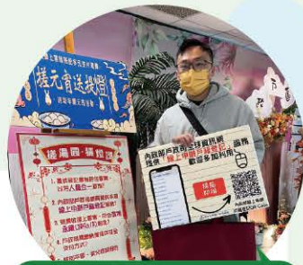
搓元宵猜燈謎送提燈活動