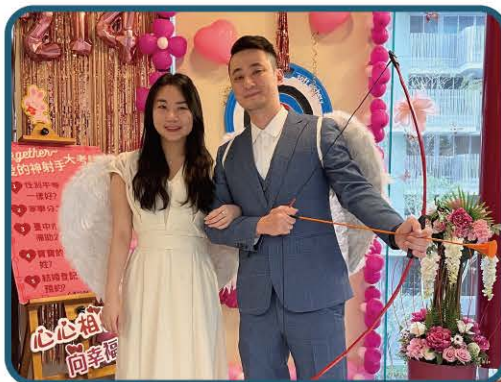
免getogether愛的神射手情人節 結婚登記特別活動