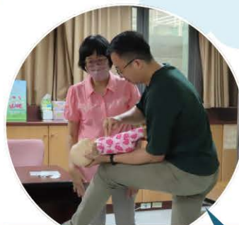
112年新住民育兒知能輔導班