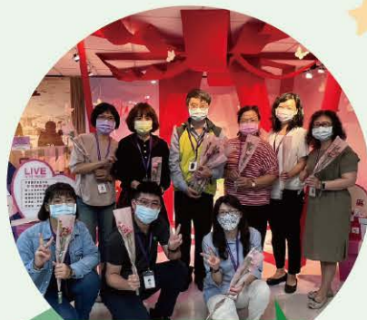
母親節致贈康乃馨活動