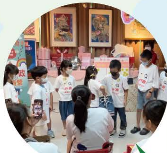
大手牽小手戶政尋寶趣 親子體驗營活動